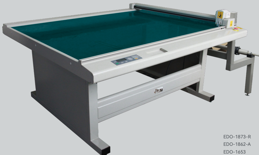
EDO-1873-R EDO-1862-A EDO-1653